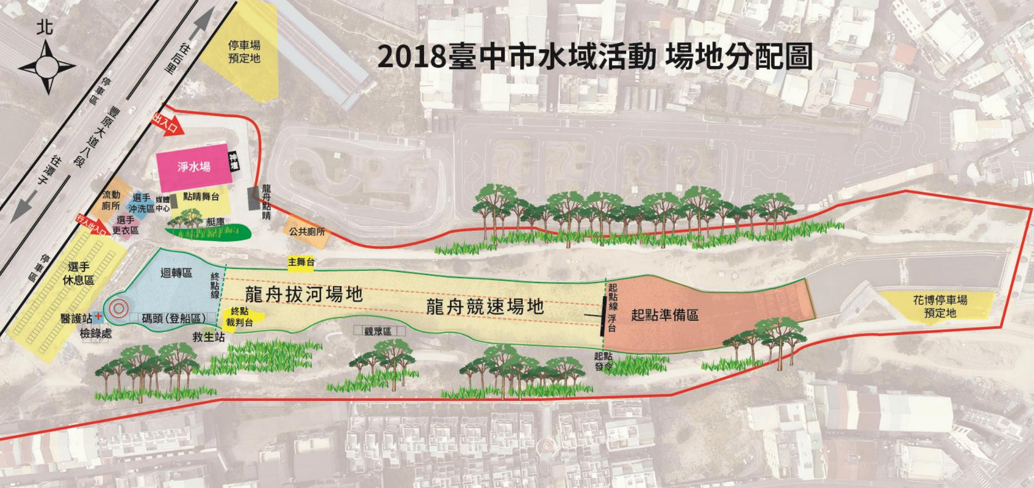
附件 1 場地分配圖